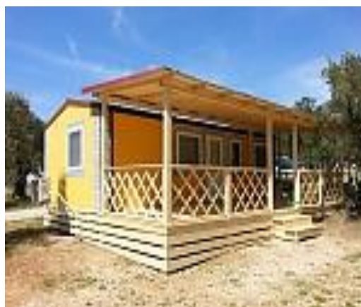
Slika 02: Počitniška hiša v kampu Miran Pirovac