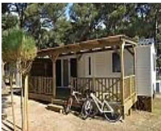
Slika 01: Počitniška hiša v kampu Kozarice

V SVPS se je po odhodu starejše generacije sindikalistov začelo ustvarjati temelje za nadaljnji razvoj sindikata, ki se bo sposoben prilagoditi novim izzivom. Poleg vseh običajnih sindikalnih aktivnosti je bilo tudi na ostalih področjih veliko narejenega. Prijetna novost za člane sindikata je bil nakup mobilnih hišic v Pakoštanah in Pirovcu v R Hrvatski. Z uvedbo spletne strani SVPS smo prvič v zgodovini skozi svoj lasten elektronski medij dobili možnost za promocijo aktivnosti SVPS in TVD-ja, ter ostalih dejavnosti.