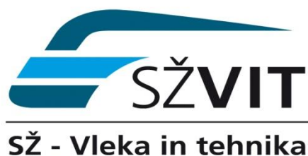
Slika 05: Logotip odvisne družbe SŽ VIT d.o.o.

03. izredna seja Glavnega odbora S V P Slovenije (13. 10. 2011) nas je seznanila z gradivom in pobudo sindikatov o ustanovitvi Sveta delavcev novo ustanovljene družbe dejavnosti CD-ja, Vleke in TVD-ja, ter skupnim ciljem vseh sindikatov SŽ d.o.o. o formiranju Sveta delavcev kapitalsko povezanih družb.