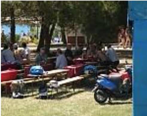
Slika 01: Utrinek iz srečanja v Strunjanu

V mesecu juniju 2011 je bilo tradicionalno srečanje SVPS organizirano v Strunjanu.