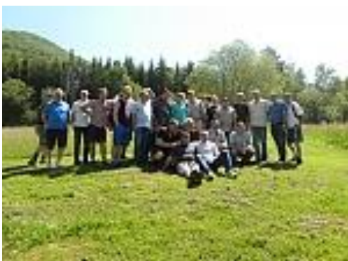
Slika 08 in 09: Udeleženci pohoda na Boč

24. tradicionalno srečanje članov SVPS je potekalo v planinskem domu na Boču.