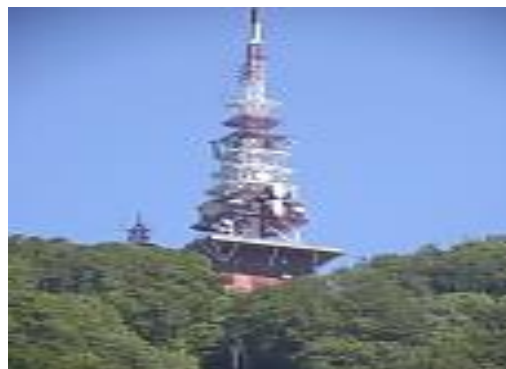
Slika 09: Oddajnik na Boču

V poletnih mesecih leta 2014 je bilo ustanovljeno Zavezništvo sindikatov energetske, železniške, pristaniške in cestne dejavnosti Slovenije, katere del je tudi SVPS. Deset sindikatov iz energetske, železniške, pristaniške in cestne dejavnosti je sklenilo zavezništvo z