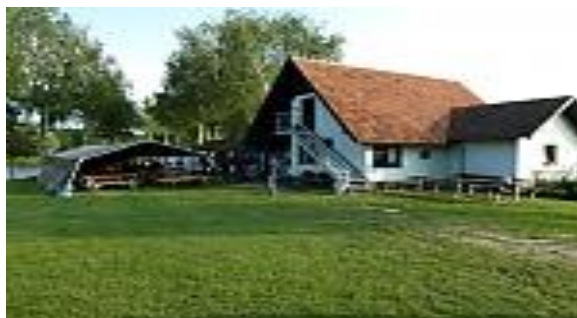
Slika 06: Prireditveni prostor Srečanja SVPS je bil glinokop pri Pragerskem

22. tradicionalno srečanje SVPS je bilo organizirano v Pragerskem