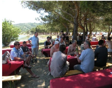
Slika 02: Sproščeno vzdušje članstva SVPS

02. redna seja Glavnega odbora S V P Slovenije (01. 06. 2011) se je začela z informacijo o reševanju problematike delavcev, ki so bili uvrščeni na interni trg dela (ITD). Nadaljevale so se tudi aktivnosti okoli delitve sredstev iz naslova dodatnih stroškov dela v letu 2011, sindikati so se pogajali o višini regresa za leto 2011, v Belgiji transportni sindikati organizirajo demonstracije. Namen demonstracij je bil predvsem v preveliki liberalizaciji prometnih tokov na železniških infrastrukturah, demonstracij sta se udeležila tudi predstavnika SVPS.