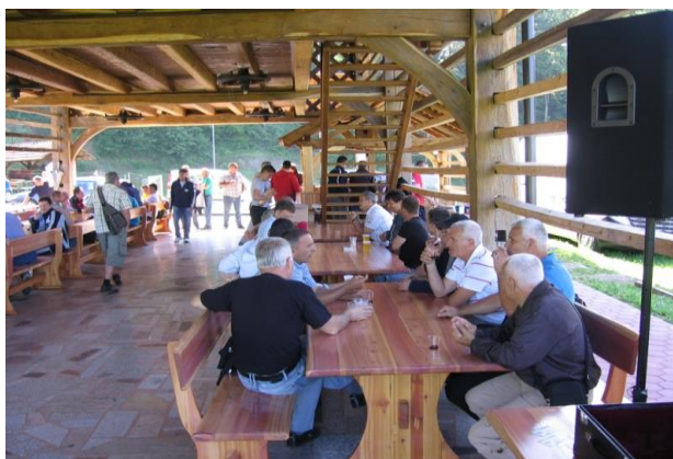
Slika 07: Osrednji prireditveni prostor Srečanja SVPS 2013 v Jelšah je bil obnovljeni kozolec

23. tradicionalno srečanje članov SVPS je potekalo v Jelšah.