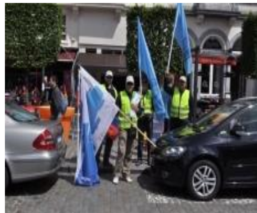
Slika 03 in 04: Na demonstracijah v Bruslju tudi z zastavo SVPS